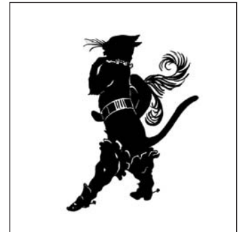
de gelaarsde kat